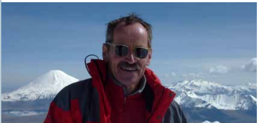
Pascal Aebischer Embajador de Suiza

Con la mirada puesta en las próximas fiestas de fin de año, de antemano les deseo estimados lectores y lectoras: todo lo mejor y un Feliz Año Nuevo